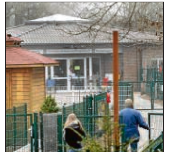
Tierheim und -Pension am Gallberger Weg. ■ Foto: Rother

HAMM ■ Morgen entscheidet sich das Schicksal des vom Tierschutzverein betriebenen Tierheims mit Tierpension am Gallberger Weg. Auf einer außerordentlichen Versammlung soll über den Vorschlag des Vorstands entschieden werden, das Gelände zu einem Festpreis von 50000 Euro an die Stadt Hamm zu übertragen. Eine Nachnutzung durch den Tierpark ist vorgesehen. → Lokales